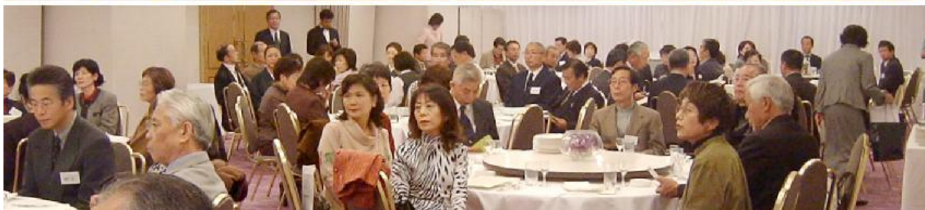
▲平成15年度・総会風景 2003/11/15「東洋ホテル」にて